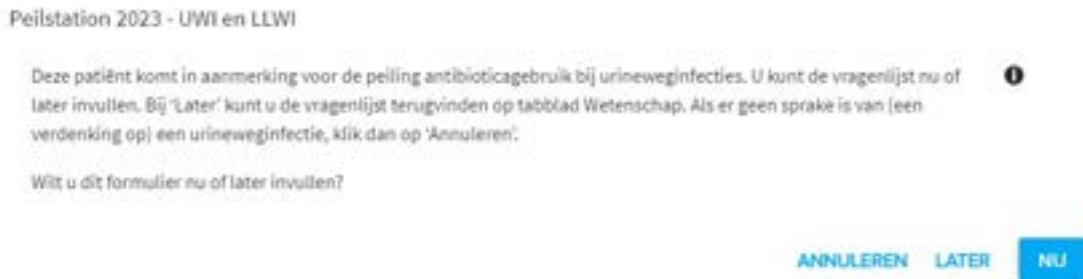
Figuur 3.1: Pop-up voor het invullen van de vragenlijst van de UWI peiling.

Het systeem registreert of er bij een cliënt al eerder een vragenlijst is ingevuld. Als dat zo is, verschijnt er bij UWI en LLWI 14 dagen na het opslaan van de vragenlijst geen nieuwe pop-up. Bij Psychofarmaca verschijnt er 24 uur geen pop-up.