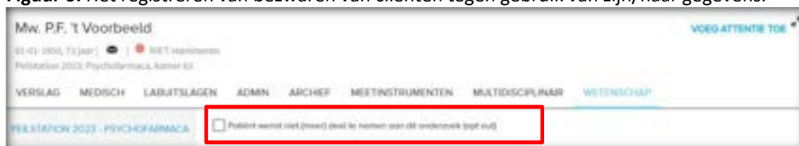
Figuur 6: Het registreren van bezwaren van cliënten tegen gebruik van zijn/haar gegevens.

Indien uw organisatie aan beide peilingen meedoet, dient u dus zowel bij Peilstation 2023 – UWI en LLWI als bij Peilstation 2023 – Psychofarmaca de opt-out aan te vinken. Er verschijnen dan geen pop-ups meer bij deze cliënt en de onderzoekers ontvangen geen gegevens over deze cliënt.